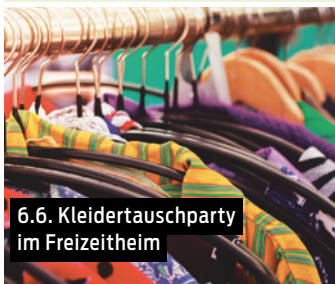
6.6. Kleidertauschparty im Freizeitheim