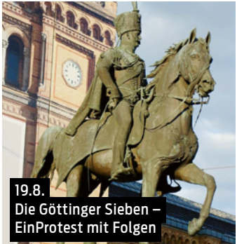
19.8. Die Göttinger Sieben – Ein Protest mit Folgen

Als König Ernst August I. 1837 die Verfassung aufhob, rechnete er mit Gehorsam, doch ... Kommen Sie mit nach Göttingen auf eine Spurensuche über Prinzipientreue, einen wütenden König und die