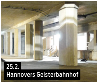
25.2. Hannovers Geisterbahnhof

Wir besuchen einen der vielleicht geheimsten Orte in Hannover: Die Geisterstation unter dem Raschplatz am Hauptbahnhof. Achtung, die Füh-