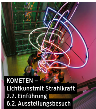
KOMETEN – Lichtkunst mit Strahlkraft 2.2. Einführung 6.2. Ausstellungsbesuch

Wir besuchen das einzigartige Museum für Lichtkunst in Celle, das