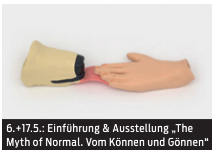
6. +17.5.: Einführung & Ausstellung „The Myth of Normal. Vom Können und Gönner“