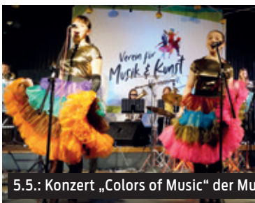
5.5.: Konzert „Colors of Music“ der Mu

Genießen Sie mit dem Verein für Musik und Kunst Hannover e.V. eine bunte Show und mitreißende Live-Musik beim