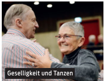
Geselligkeit und Tanzen

Neben der Geselligkeit steht das Tanzen an erster Stelle. Disco-Fox, Standard und Lateinamerikanische Tänze, auch mit Anleitung, ab und an auch mal ein Line Dance sind nicht die einzige Vielfalt die wir schätzen. Für Kaffee & Kuchen (2,50 €) und andere günstige Angebote wird gesorgt. Immer mittwochs.