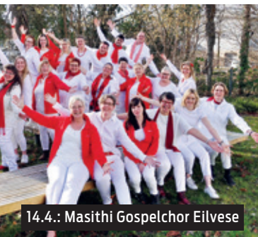
14.4.: Masithi Gospelchor Eilvese