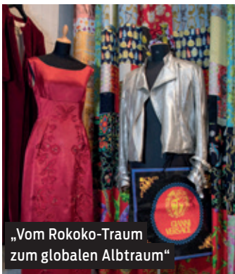
„Vom Rokoko-Traum zum globalen Albtraum“

Die aktuelle Ausstellung im Museum für textile Kunst spannt einen überaus unterhaltsamen und informativen Bogen von der Mode des Rokokos über das Zeitalter der Automatisierung und Industrialisierung bis hin zu aktuellen Fragen nach Produktions- sowie Arbeitsbedingungen und Fragen der Nachhaltigkeit in der Mode. Im Anschluss gibt es die Möglichkeit die neuen Eindrücke