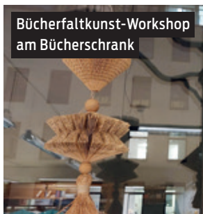
Bücherfaltkunst-Workshop am Bücherschrank

wie das Abstimmen von Terminen für Feste, Umzüge oder größere Stadtteilaktivitäten. Wenn Sie Interesse an einer Mitarbeit haben, melden Sie sich bitte im Freizeitheim Döhren.