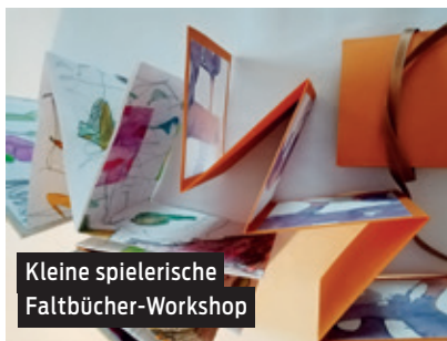
Kleine spielerische Faltbücher-Workshop